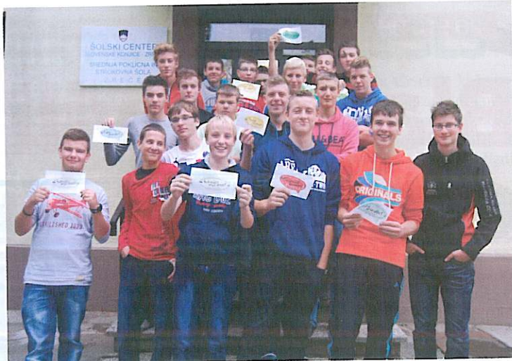
Raznolik jezikovni program je dijakom in profesoricom obogatil šolski vsakdan.