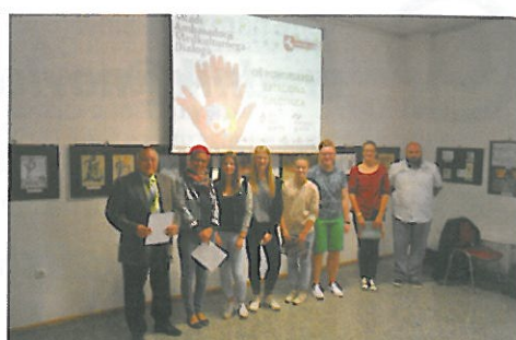
V preteklem šolskem letu so bile v Oplotnici izvedene Urice na temo LGBT skupnost.