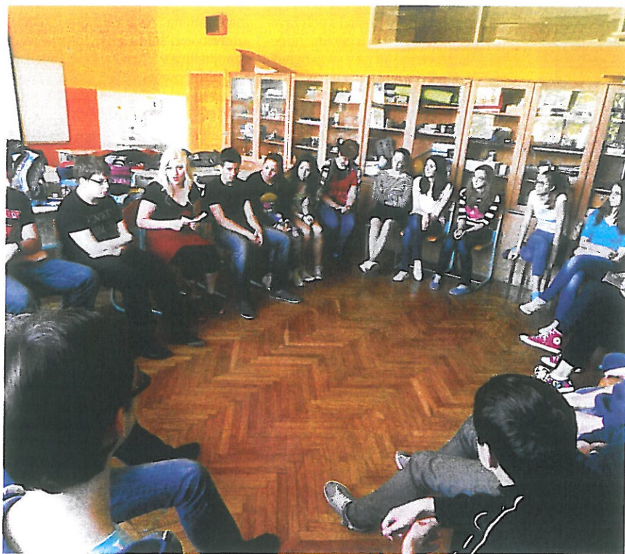
Otroci imajo za goste in gostje Uric vedno veliko vprašanj.