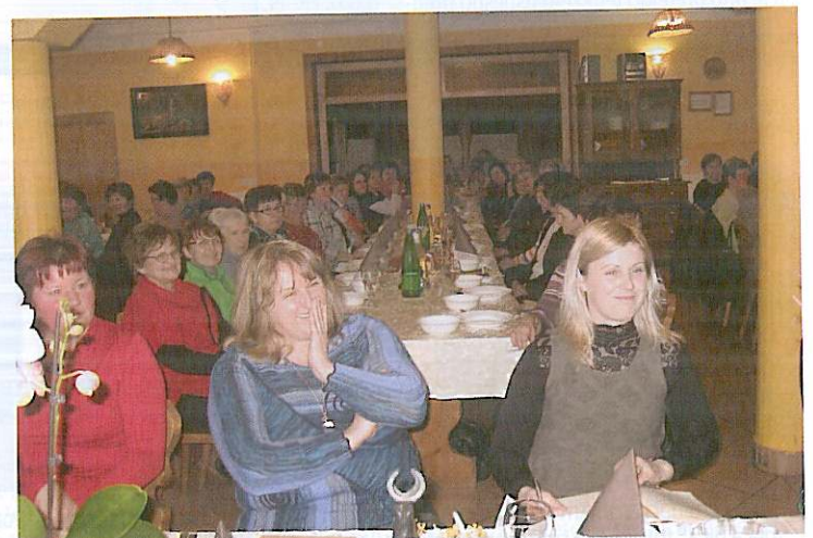
Zbrale so se na Turistični kmetiji Lopan.