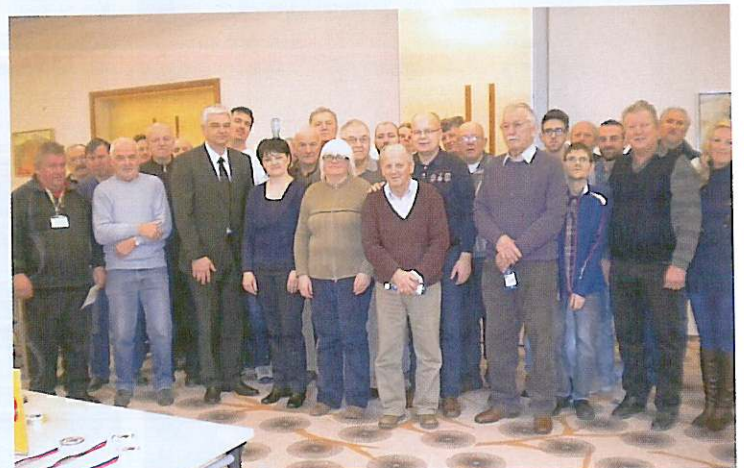
Za šahovnico so se pomerili v Zrečah.