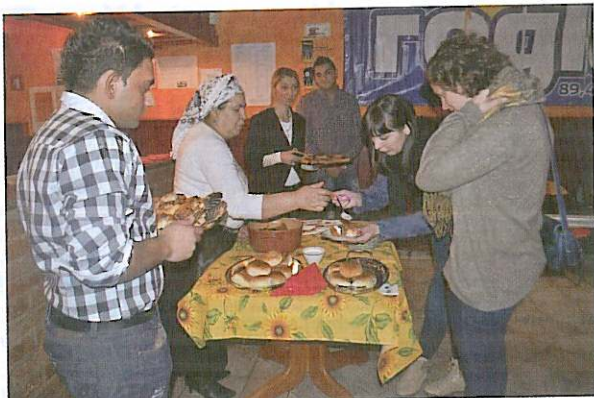
Obiskovalci so lahko poskusili tradicionalne romske jedi.