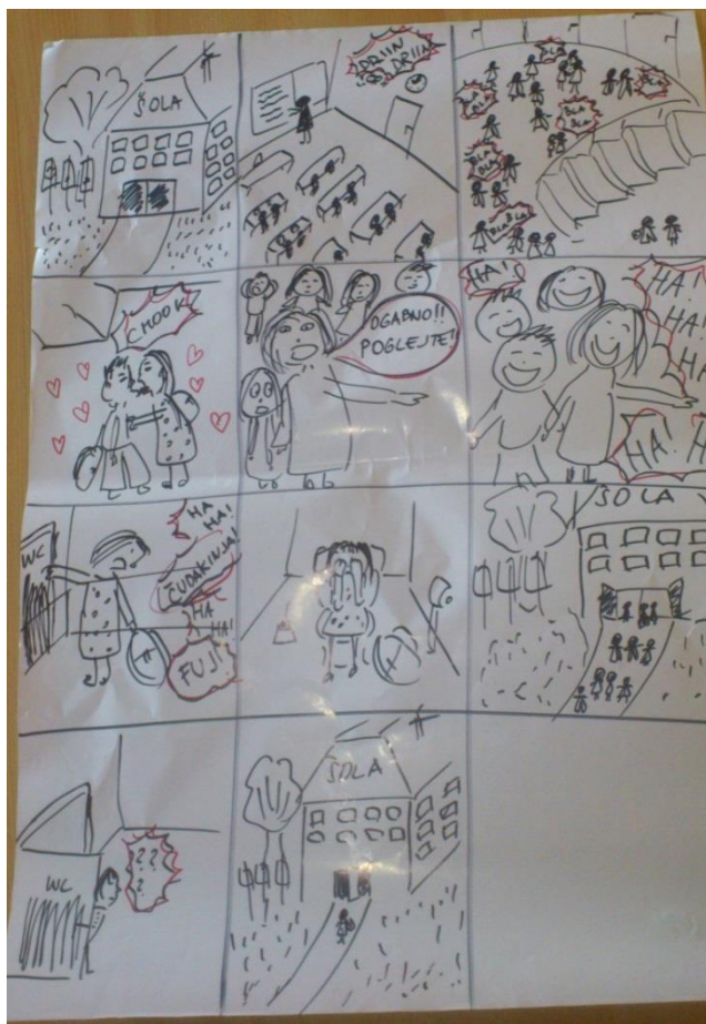
Slika 2: Primer stripa.